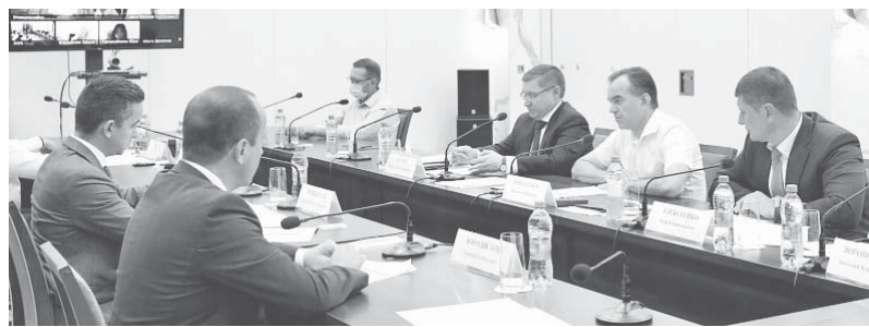
Вениамин Кондратьев в Геленджике оценил ход строительных работ по созданию глубоководного выпуска

— Вопрос строительства новых очистных сооружений назрел давно. С их помощью мы снизим экологическую нагрузку на город, по-