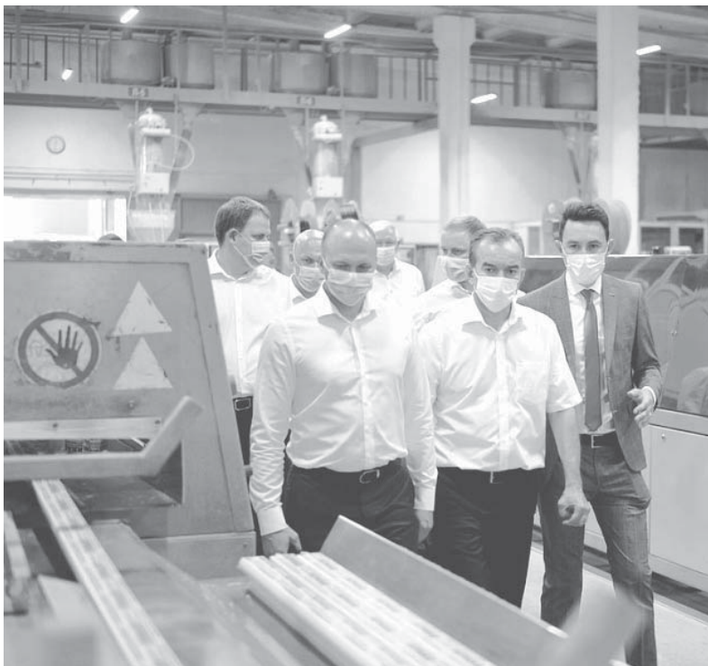
Вениамин Кондратьев побывал с рабочим визитом в Крымском районе

Четыре года назад начал формироваться механизм региональной