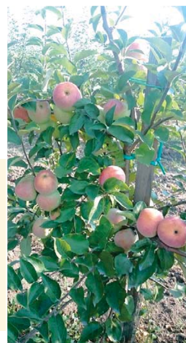
Плоды вкусные и красивые

Средние летние сорта яблок начинают собирать в начале августа, в середине месяца собирают сливу сорта «стенлей». С начала осени и до конца ноября убирают поздние сорта яблок, сортируют их и реализуют. Словом, работы хватает на круглый год.