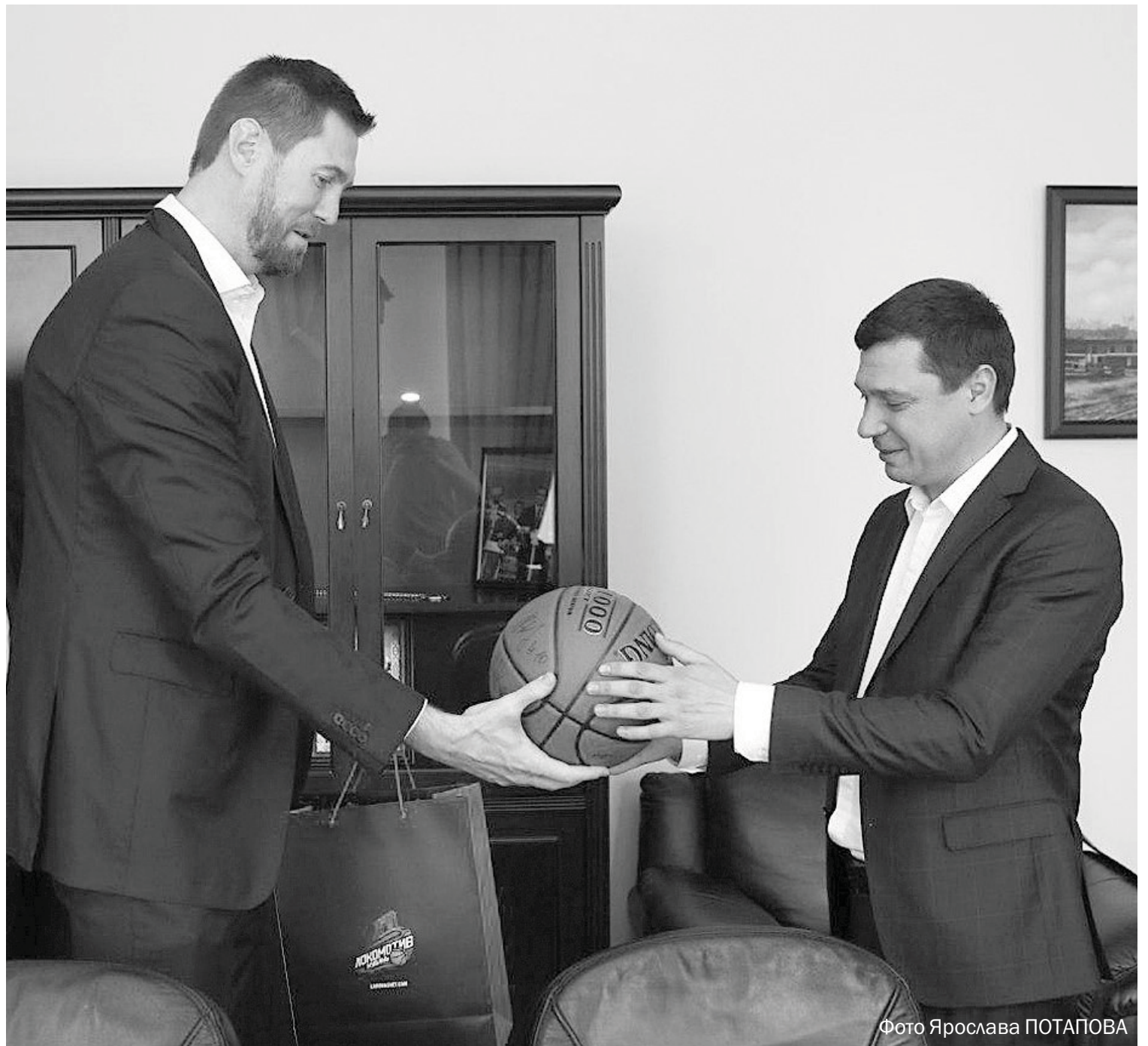
Фото Ярослава ПОТАПОВА

Пресс-служба УФНС России по Краснодарскому краю