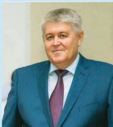
Глава города-курорта Анапы С. П. Сергеев

Дорогие друзья! Анапа — единственный в России федеральный курорт детского и семейного отдыха, город с уникальным климатом и богатейшей историей, насчитывающей