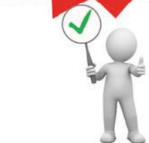
Скидка 10% при единовременной оплате

До 30 апреля 2017 г. в Краснодарской бальнеолечебнице акция «Весна подарков»: скидка 10% при единовременной оплате назначенного врачом курса процедур. В мае в Краснодарской бальнеолечебнице запланировано повышение цен на ряд процедур. При оплате курса процедур до 30 апреля вы сможете воспользоваться двойной выгодой: старые цены + скидка 10% при единовременной оплате назначенного врачом курса процедур.