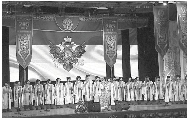
ценной самобытным музыкальным талантам России.

Гастрольный тур Кубанского казачьего хора прошел под патронатом Министерства культуры Краснодарского края и при поддержке фонда Олега Дерипаски «Вольное дело».