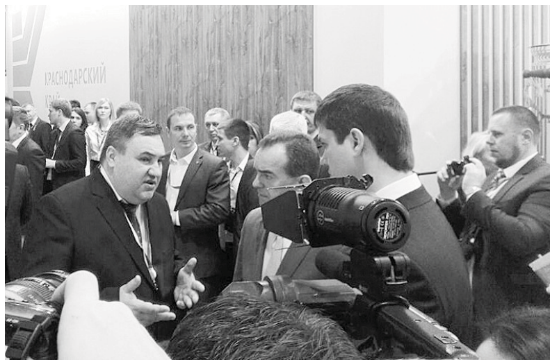
ременным хранением 21 300 тонн, с линиями по предпродажной подготовке и переработке мощностью более 100 тысяч тонн в год. Проект

Во второй день наш инвестиционный портфель пополнился еще одним соглашением о намерении строительства в станице Марьянском логистического центра. Его инициатором выступило ЗАО «Гримел Логистик». Это будет комплекс складских помещений с универсальным режимом хранения овощей, фруктов, единов-