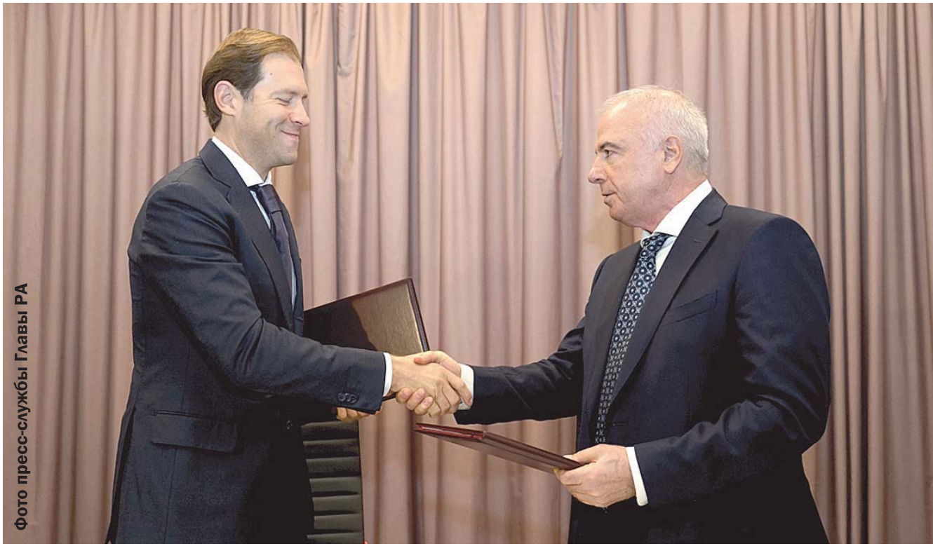
Д. Мантуров и А. Тхакушинов подписали соглашение

На расширенном заседании Кабинета министров Адыгеи ключевым вопросом повестки дня стало обсуждение итогов социально-экономического развития республики за девять месяцев 2015 года. Провел заседание глава республики Аслан Тхакушинов.