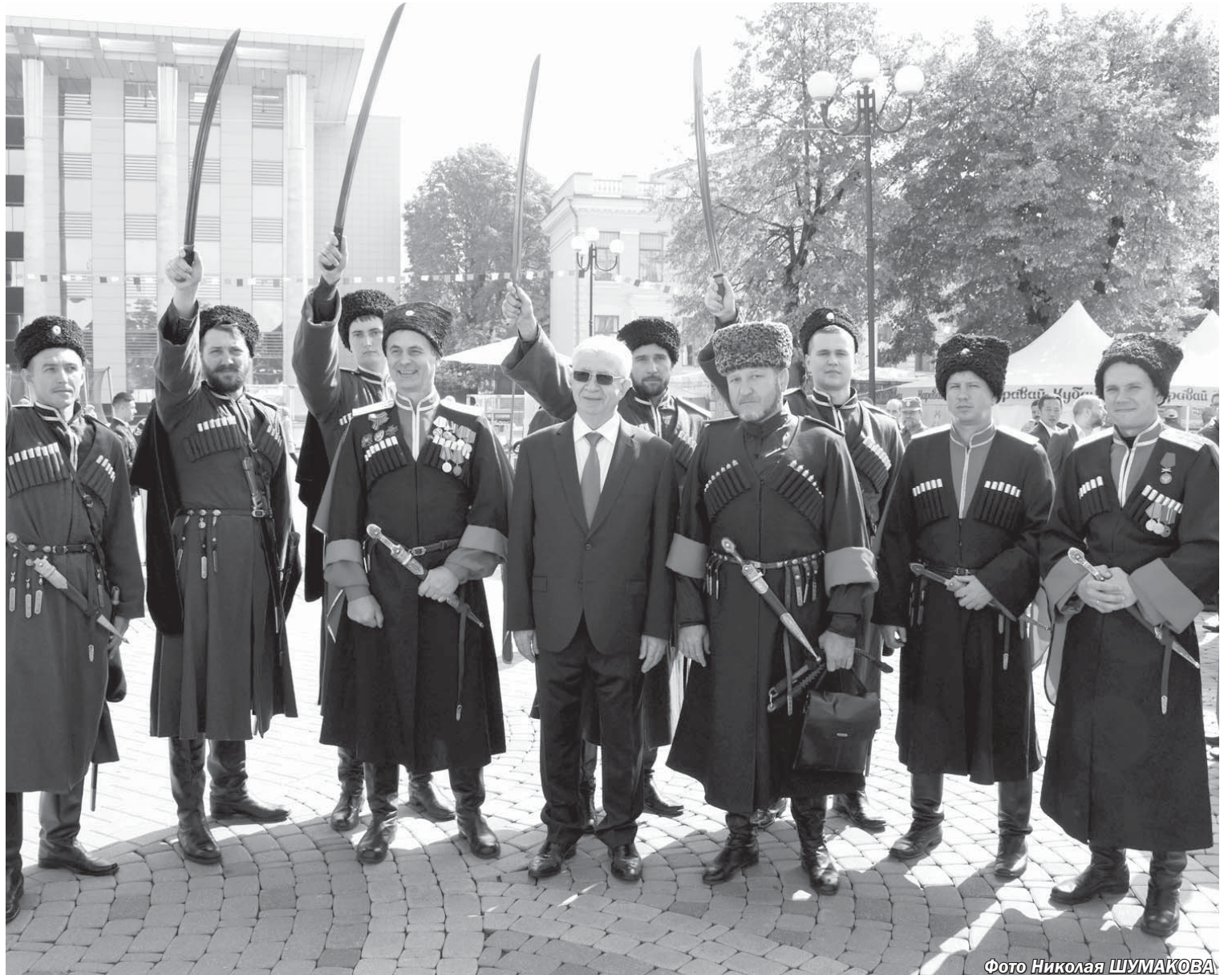
Фото Николая ШУМАКОВА

Пресс-служба администрации Краснодарского края