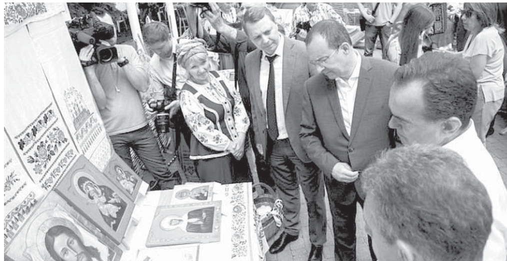
Губернатор Вениамин Кондратьев и спикер кубанского парламента Юрий Бурлачко осматривают экспозицию выставки-ярмарки

Для многих горожан и гостей краевой столицы, которые бывают в это время года в наших краях, посещать это яркое и запоминающееся мероприятие стало уже традицией, ведь во время него можно не только попробовать кубанские деликатесы и вино, послушать казачьи народные песни, купить самые разные сувениры, созданные руками лучших мастеров региона, но и самим узнать некоторые секреты декоративно-прикладного творчества в рамках мастер-классов, получить информацию о самых разных объектах агротуризма, где можно интересно и с пользой провести драгоценные минуты своего отпуска.