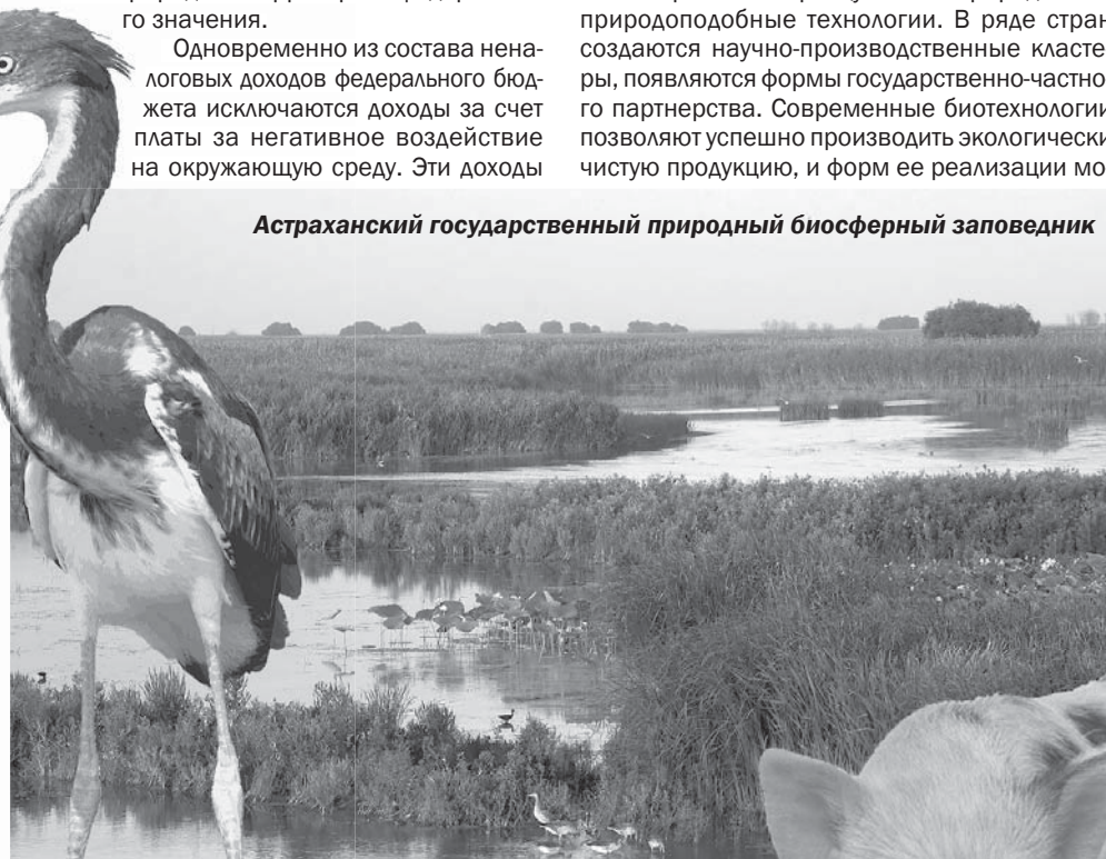
Астраханский государственный природный биосферный заповедник