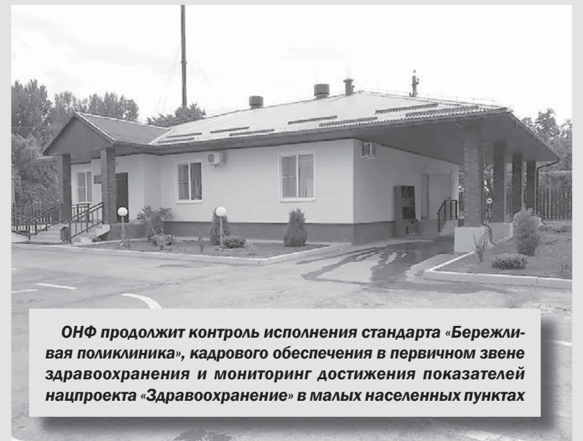
ОНФ продолжит контроль исполнения стандарта «Бережливая поликлиника», кадрового обеспечения в первичном звене здравоохранения и мониторинг достижения показателей нацпроекта «Здравоохранение» в малых населенных пунктах

— В 2019 году в собственность края было принято 143 муниципальных медицинские организации со всем имуществом на балансе, включая 654 ФАПа. В ходе инвентаризации Минздравом было выявлено, что администрации муниципалитетов зачастую не принимали меры по надлежащему содержанию материально-технической базы учреждений, также не выделялись средства