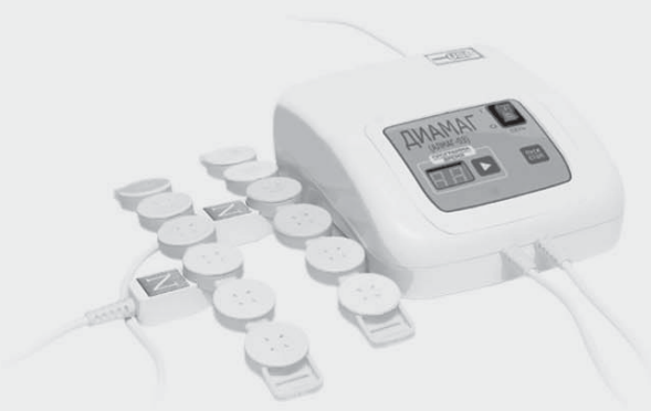
ДИАМАГ Путь к восстановлению!

Аппарат по назначению специалиста можно использовать на пятые сутки после перевода пациента из реанимационного отделения.