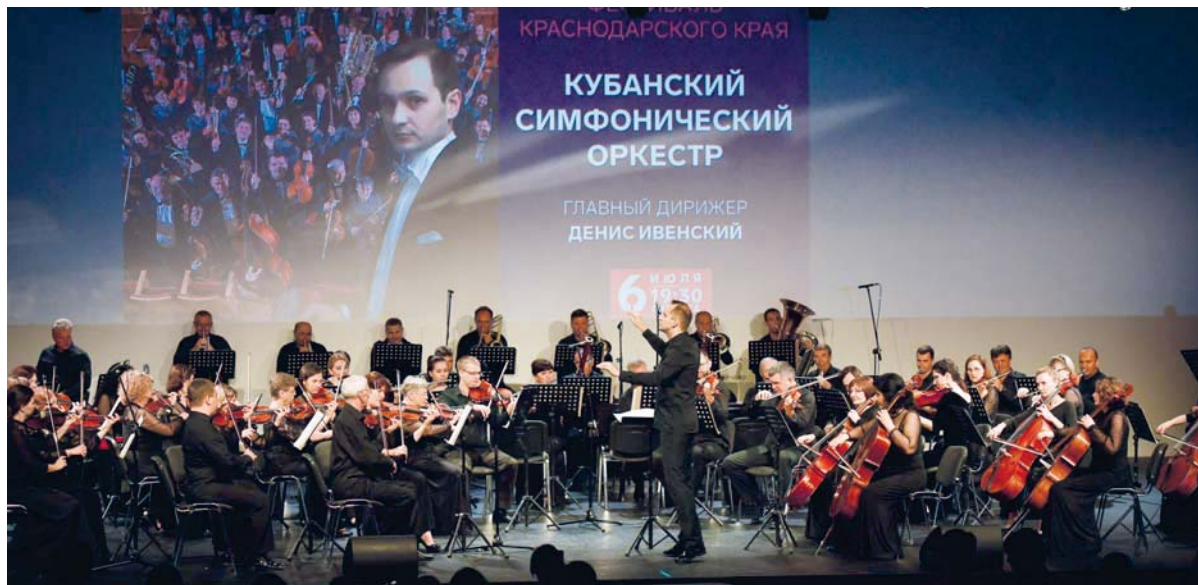
КУБАНСКИЙ СИМФОНИЧЕСКИЙ ОРКЕСТР НА СЦЕНЕ ПАРКА НАУКИ И ИСКУССТВА «СИРИУС»

Камерное направление в исполнительстве всегда очень сложно продаваемое, но в афише ему обязательно должен быть отведен один или два дня в месяц — об этом мы недавно гово-