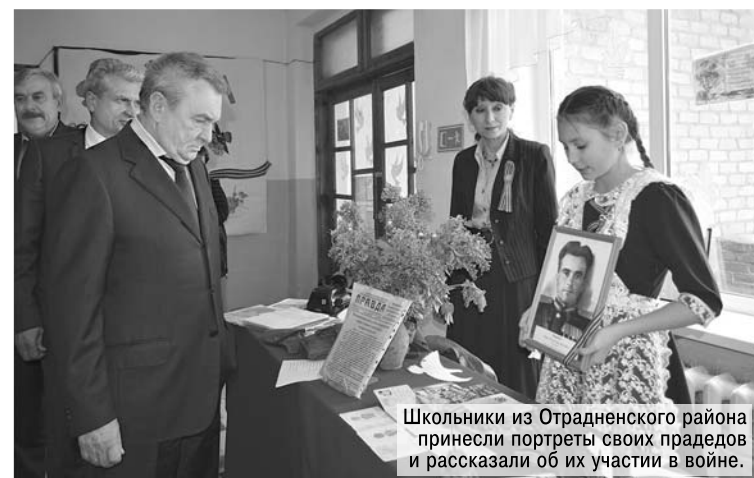
Школьники из Отрадненского района принесли портреты своих прадедов и рассказали об их участии в войне.