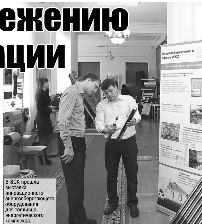
В ЗСК прошла выставка инновационного энергосберегающего оборудования для топливо-энергетического комплекса.

30 лет. Кубань имеет опыт практического применения альтернативных источников энергии. С участием кубанских ученых построена самая большая в России гелиоустановка площадью 4400 квадратных метров в Астраханской области. В нашем регионе эксплуатируется 150 гелиоустановок общей площадью 7000 квадратных метров мощностью 5 мегаватт. Больше половины их работает на Черноморском побережье для гостиниц и санаториев, на социальных объектах установлено 700 квадратных метров солнечных коллекторов. В городе Усть-Лабинске уже три года горячее водоснабжение районной больницы осуществляется с помощью гелиоустановки площадью 600 квадратных метров, выполненной на уровне лучших зарубежных образцов. Но резерв в использовании солнечной энергии очень большой. Ученые Кубанского государственного аграрного