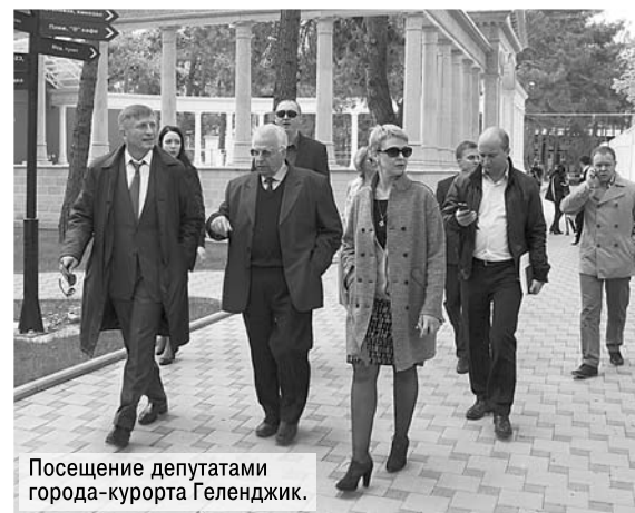
Посещение депутатами города-курорта Геленджик.

С учетом обсуждения на «круглом столе» были приняты рекомендации краевым ведомствам, образовательным учреждениям и общественным организациям. Среди прочего краевому министерству образования предлагается составить списки рекомендованных к использованию школами края учебников и пособий по истории России и Кубани, книг для чтения, посвященных участию кубанцев в Великой Отечественной войне. По мнению участников «круглого стола», в учебных планах университетов, институтов, колледжей, техникумов для студентов гуманитарных специальностей должны быть введены спецкурсы, критически рассматривающие спорные вопросы трактовки различных событий российской и мировой истории. Обществу «Знание» предлагается продолжить публикацию источников личного происхождения о Великой Отечественной войне — воспоминаний, дневников, писем, других документов, повествующих о вкладе кубанцев в Победу.