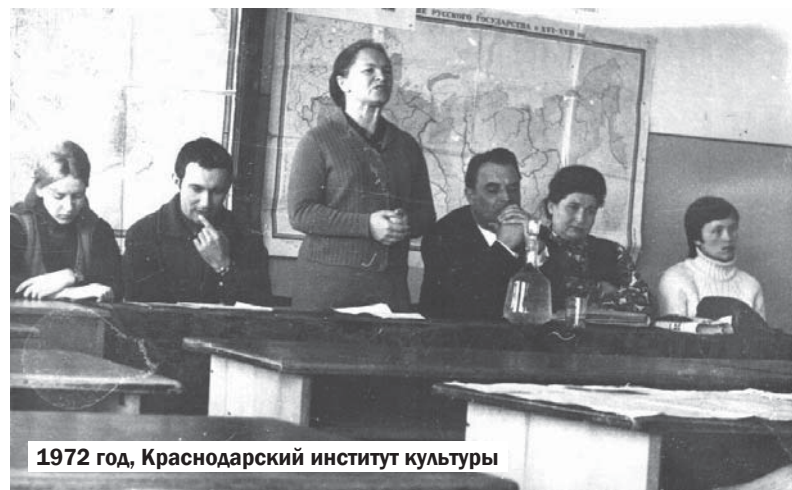
1972 год, Краснодарский институт культуры