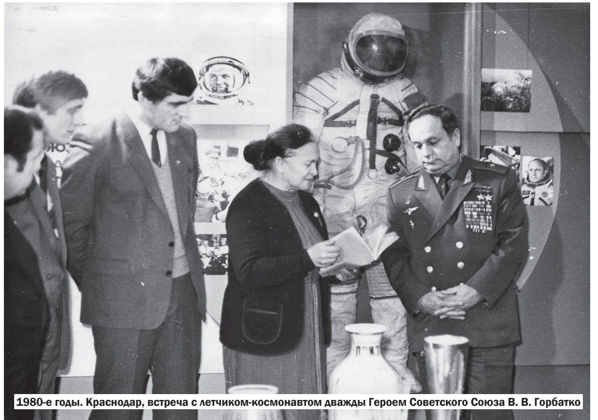
1980-е годы. Краснодар, встреча с летчиком-космонавтом дважды Героем Советского Союза В. В. Горбатко

Сегодня федерация объединяет десятки ветеранов авиационной и ракетно-космической отраслей, ветеранов космодромов Байконур, Плесецк, педагогов высшей школы, руководителей школьных музеев космонавтики, молодых ученых, широкие слои общественности. Поддерживается связь с нашими земляками — летчиками-космонавтами.