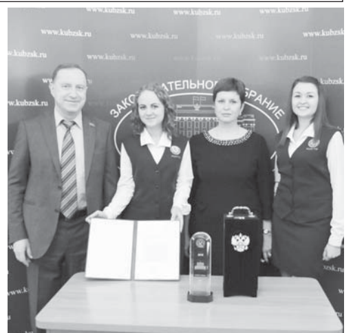
Материалы подготовила Наталия МЕЛЬНИКОВА

Получить эту премию было непросто: мало было послать отчет по самообследованию вуза, в университете работала комиссия экспертов, которая оценивала и качество подготовки студентов, и организацию научных исследований, и то, как проводится воспитательная работа. Причем проверяющие очень мало общались с руководством — всё больше ходили, смотрели, разговаривали со студентами. И в итоге признали, что этот кубанский вуз достоин быть обладателем почетной премии государственного уровня.