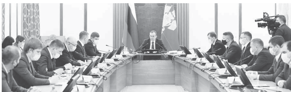
Вениамин Кондратьев на региональном совещании по вопросам использования сельхозземель

По словам вице-губернатора, больше всего нарушений в Горячем Ключе и Северском районе. В Горячем Ключе под коттеджи отдали около 567 гектаров сельскохозяйственных