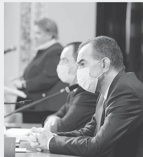
Вениамин Кондратьев принял участие в пленарном заседании Общественной палаты Краснодарского края

Вениамин Кондратьев также отметил деятельность Общественной палаты, направленную на поддержку некоммерческих организаций. В прошлом году представители Общественной палаты обратились с просьбой поддержать НКО, работающие с детьми-инвалидами.