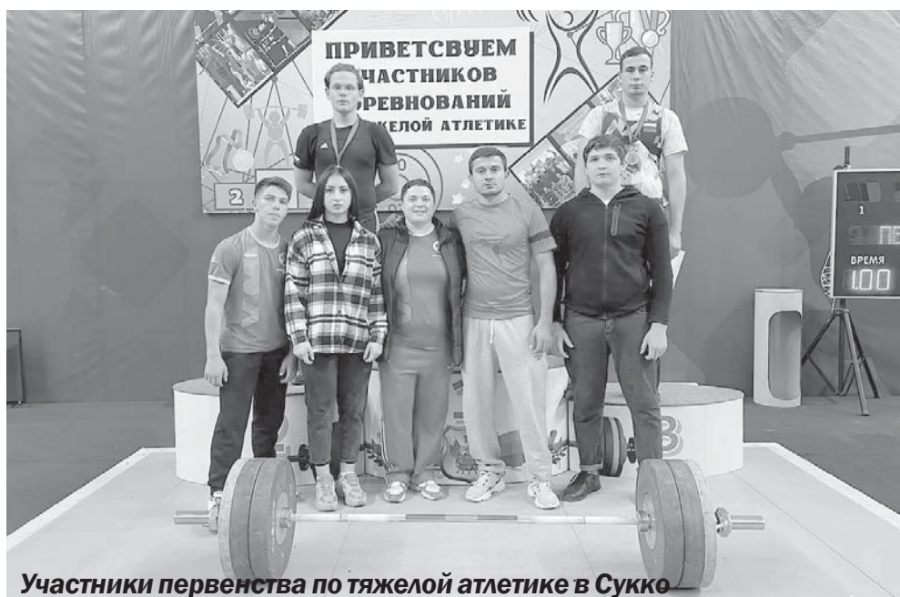
Участники первенства по тяжелой атлетике в Сукко

— А как идет подготовка к соревнованиям в Грозном? Кто туда поедет и по како-