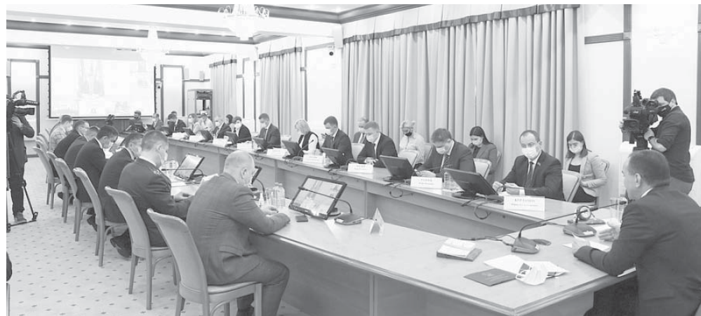
Глава администрации (губернатор) Краснодарского края Вениамин Кондратьев на совещании регионального проектного комитета по реализации национальных проектов

Глава администрации (губернатор) Краснодарского края Вениамин Кондратьев на совещании регионального проектного комитета по реализации национальных проектов поручил ускорить работу.