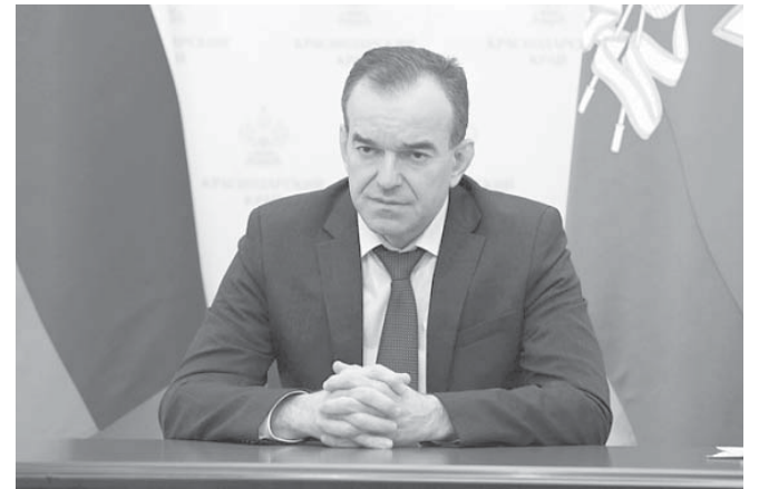
Глава администрации (губернатор) Краснодарского края Вениамин Кондратьев принял участие в совещании по вопросу организации работы регионов Южного федерального округа

Вениамин Кондратьев также сказал, что сегодня в регионе готовы строить пять школ в рамках концессии со сроком