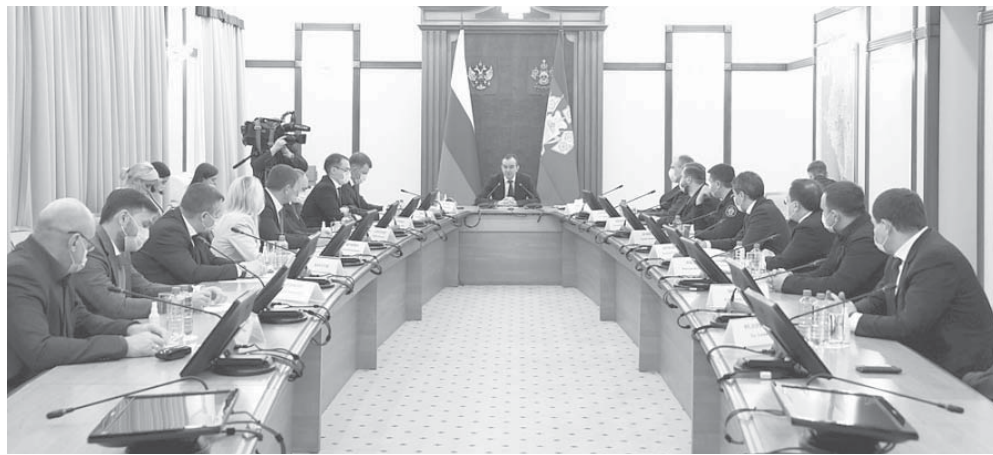
Глава администрации (губернатор) Краснодарского края Вениамин Кондратьев провел совещание, посвященное работе по завершению кубанских долгостроев

— Но в условиях санкций многие предприятия сталкиваются с дополнительными трудностями. Строительный блок не исключение. Подрядчики должны закупить всю линейку стройматериалов, чтоб закончить строительство домов. У нас нет права переносить сроки — до конца 2023 года мы должны закрыть проблему дольщиков,— подчеркнул глава края.