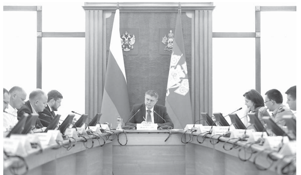
Первый заместитель главы администрации (губернатора) Краснодарского края Игорь Галась провел заседание краевой комиссии

Первый заместитель главы администрации (губернатора) Краснодарского края Игорь Галась провел заседание краевой комиссии, на котором обсудили вопросы погашения долгов по заработной плате.