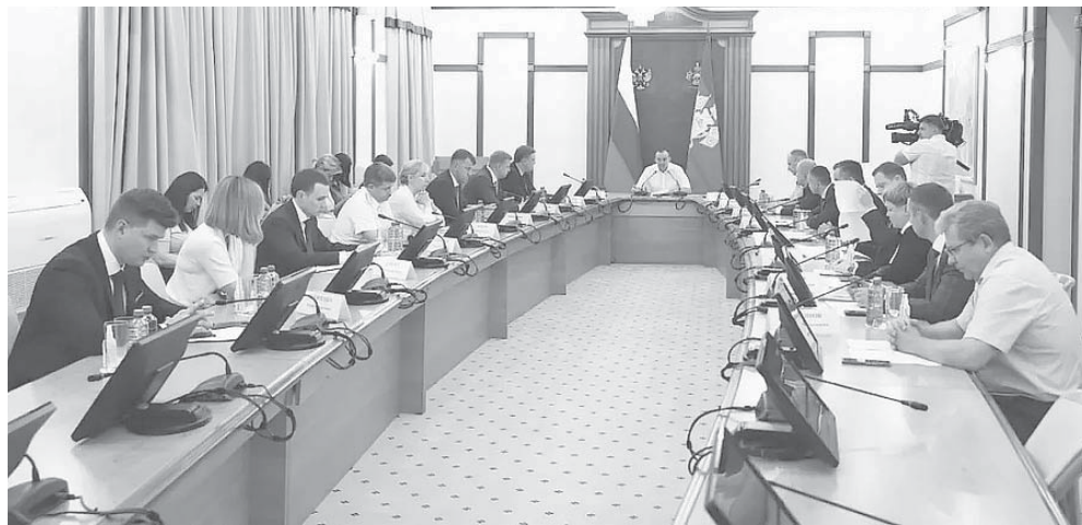
Глава администрации (губернатор) Краснодарского края Вениамин Кондратьев на краевом совещании

Вениамин Кондратьев отметил, что по итогам первого полугодия освоено 29,8 миллиарда рублей — 42 процента средств от плана. Это на уровне 2021 года. Наибольшую