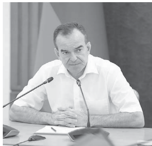
Глава администрации (губернатор) Краснодарского края Вениамин Кондратьев провел час контроля

Глава администрации (губернатор) Краснодарского края Вениамин Кондратьев на традиционном часе контроля проверил исполнительскую дисциплину в регионе.