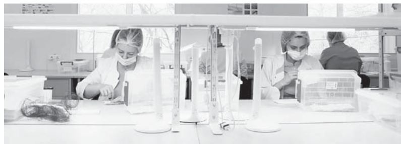
Продукцию компании реализуют на рынках России и Республики Беларусь