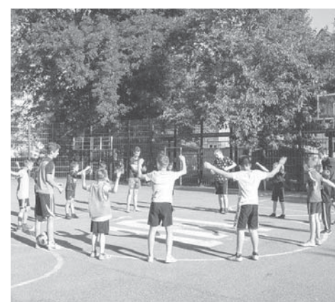
В августе на спортплощадках города планируют провести четыре «Зарядки с чемпионом»

Напомним: спортивные занятия организованы более чем на двадцати площадках по месту жительства. Помимо занятий физкультурой, мини-футболом, баскетболом, волейболом, бадминтоном и настольным теннисом, регулярно проходят товарищеские матчи и «Веселые старты». Кроме того, инструкторы по спорту Центра физкультурно-массовой работы помогают краснодарцам подготовиться к выполнению нормативов Всероссийского физкультурно-спортивного комплекса «Готов к труду и обороне».