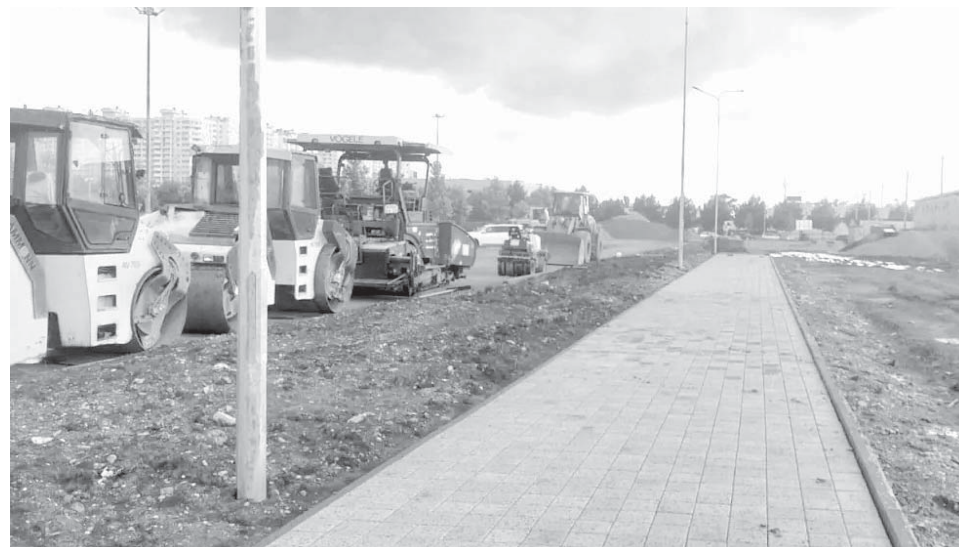
Продолжается прокладка новой подъездной дороги к школе

К школе продолжается прокладка новой подъездной дороги. Ее протяженность — 1,2 километра. Вдоль проезжей части сделают уличное освещение, тротуары и автобусные остановки, проложат сети ливневой канализации. Срок окончания работ по контракту — конец сентября, однако движение по ней планируют открыть к первому сентября.