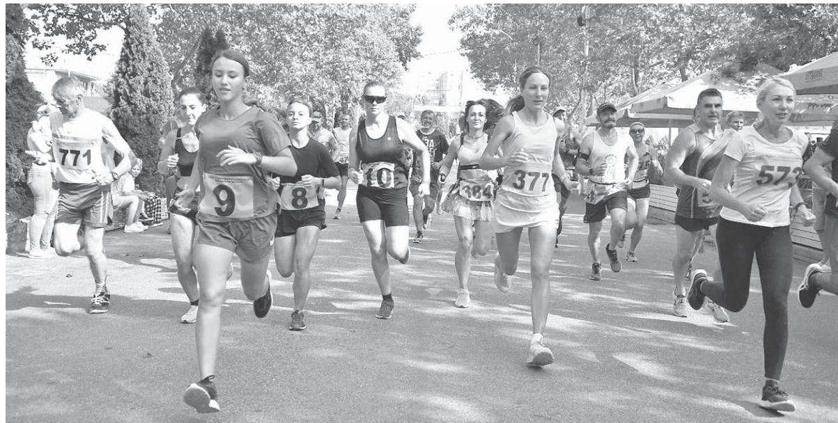
В спортивном празднике, посвященном Дню физкультурника, приняли участие тысячи краснодарцев и гостей города

Глава города отметил, что Краснодар богат спортивными победами и в этом заслуга преподавателей спортшкол — мастеров спорта, заслуженных тренеров России, наставников с большим опытом, чьи воспитанники ежегодно приносят