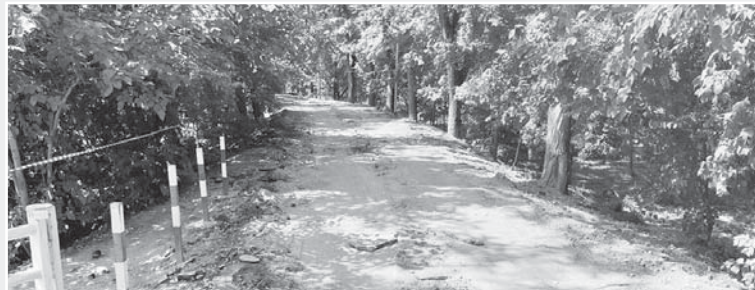
Начались подготовительные работы по благоустройству Тропы здоровья в парке имени 30-летия Победы