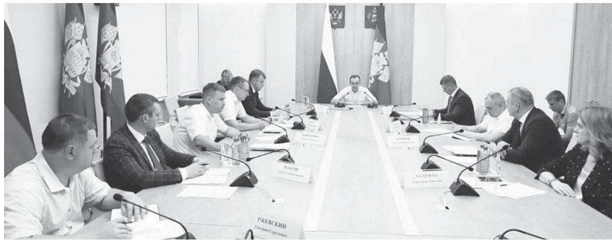
Глава администрации (губернатор) Краснодарского края Вениамин Кондратьев провел краевое совещание, посвященное сохранению объектов культурного наследия

В частности, Краснодарский край предоставляет памятники архитектуры в аренду за один рубль в год при условии их восстановления за счет инвестора. Сейчас по такой схеме реставрируют первое здание — Анапской военно-морской базы. Губернатор Вениамин Кондратьев отметил, что этот инструмент можно использовать и в отношении других исторических объектов. Главное при заключении договора — утверждать четкий график с установленными сроками всех запланированных работ и контролировать их проведение.