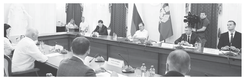
Глава администрации (губернатор) Краснодарского края Вениамин Кондратьев обсудил строительство первого в России завода по производству щелочных батареек

Было озвучено, что предприятие может рассчитывать на получение поддержки в рамках краевой госпрограммы по развитию промышленности. А также воспользоваться новым инструментом развития отрасли, вошедшим в региональный план развития экономики