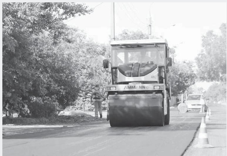
Реализация на территории краевого центра национального проекта «Безопасные качественные дороги»