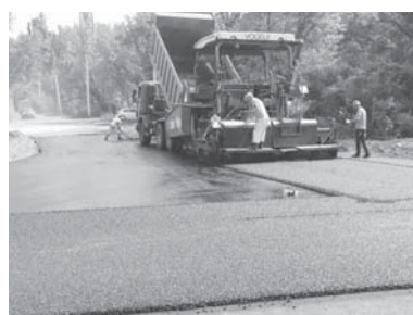
Первый этап реконструкции Почтового тракта

Рабочим осталось лишь установить забор вдоль проезжей части, чтобы предотвратить выброс мусора вдоль лесополосы. Также планируется привести в порядок откосы, установить знаки и нанести линии дорожной разметки.