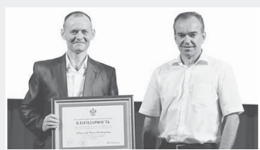
Глава администрации (губернатор) Краснодарского края Вениамин Кондратьев поздравил строителей с профессиональным праздником

Было озвучено, что профессия строителя всегда была одной из самых уважаемых. Благодаря строителям возводятся детские сады, школы, спорткомплексы, объекты агропромышленного комплекса.