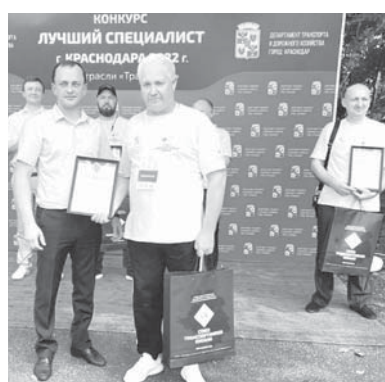
В Краснодаре подвели итоги конкурса «Лучший специалист города Краснодара»

— Этот конкурс позволяет нам выявить лучших водителей регулярных маршрутов Краснодара. Соревнования профессионалов этой отрасли также один из способов обратить внимание молодых людей на то, что можно посвятить жизнь делу, полезному для общества. В конкретном случае — перевозке пассажиров по нашему городу. Ранее каждый