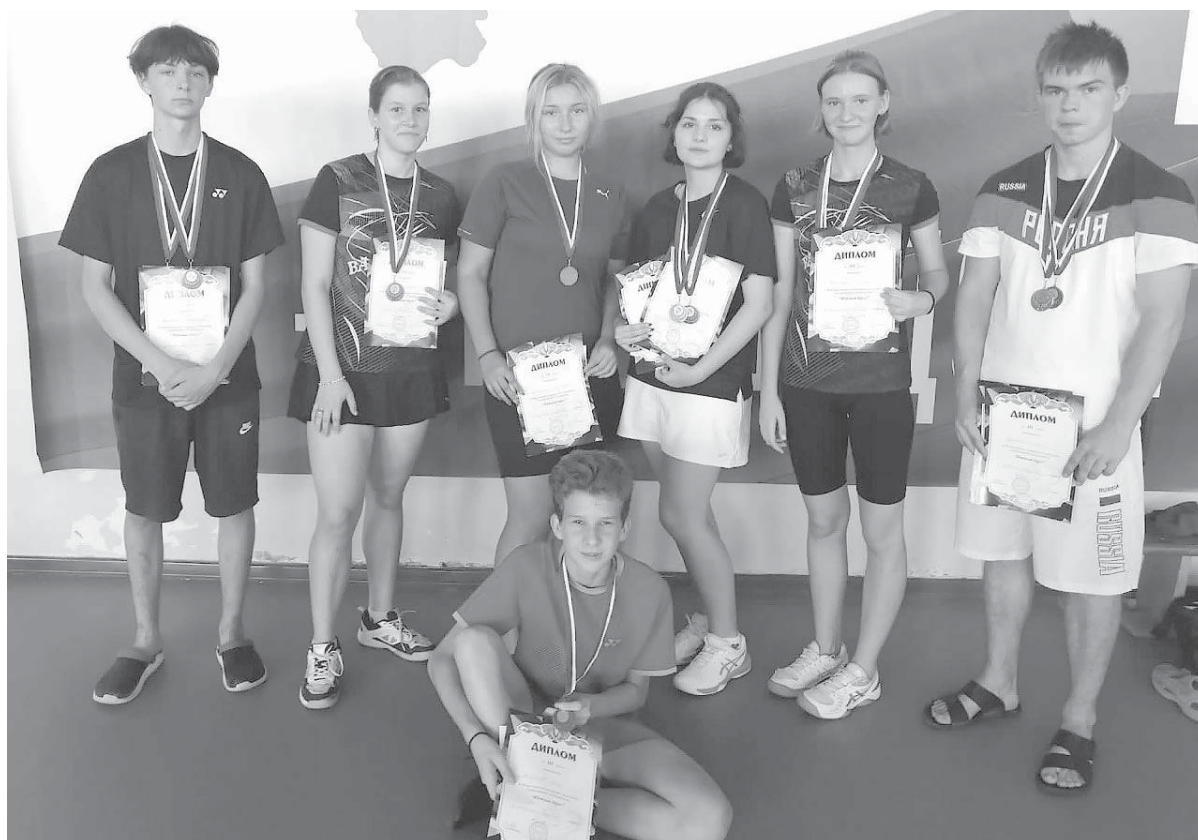
Призеры Всероссийских юношеских соревнований по бадминтону серии Гран-при в Голубицкой