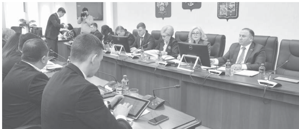
Пресс-служба администрации МО г. Краснодар