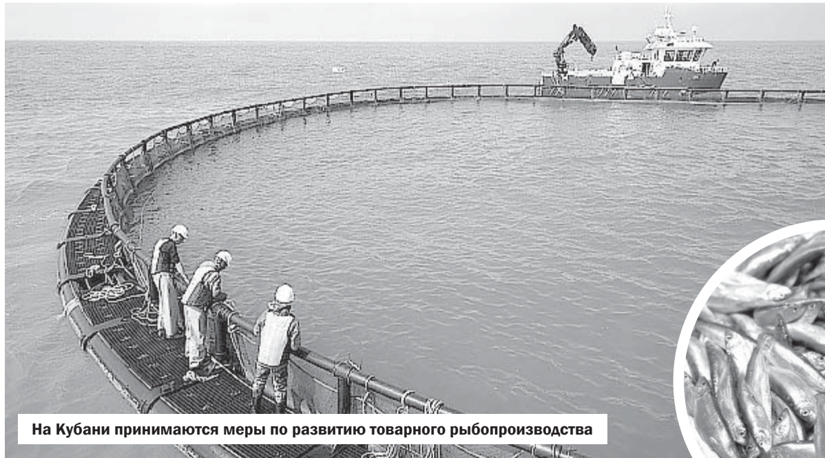
На Кубани принимаются меры по развитию товарного рыболовства

Производство рыболовского материала увеличено племенным форелеводческим заводом в Адлере. Завод является основным в России поставщиком форели для других рыбохозяйственных предприятий России и ближнего зарубежья. Предприятия взяли курс на увеличение динамики развития, наращивание производства рыбы и икры и кратное повышение рентабельности.