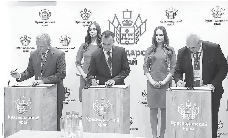
Губернатор Краснодарского края Вениамин Кондратьев

На Кубани начнут выращивать и перерабатывать черноморскую форель в промышленных масштабах. Соглашение об этом подписал Губернатор Краснодарского края Вениамин Кондратьев.