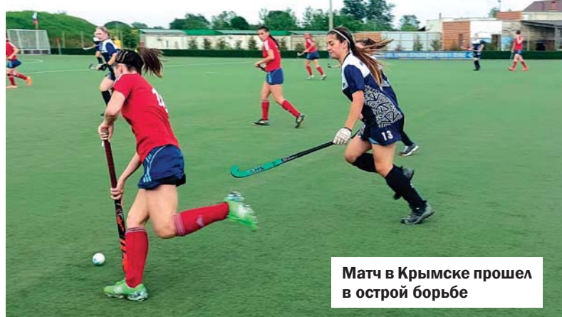
Матч в Крымске прошел в острой борьбе

А с прошлого года мы сами при поддержке Министерства спорта Краснодарского края получили возможность участвовать в Высшей лиге среди женских команд — это второй по силе дивизион в стране после суперлиги. Сыграли там два тура.