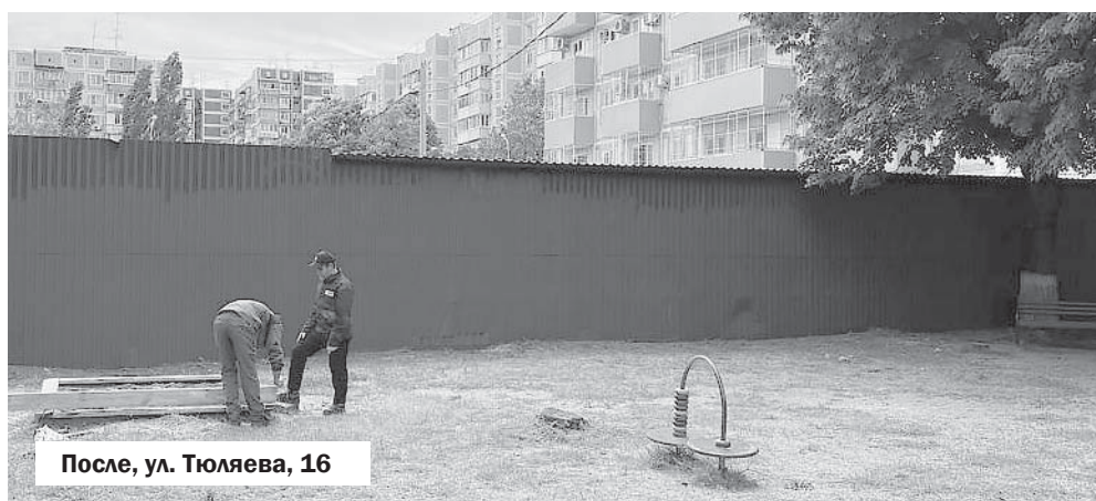
После, ул. Тюляева, 16

бокса и борьбы «Империл». На сегодняшний день в ней занимается более ста пятидесяти детей.