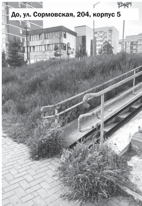
До, ул. Сормовская, 204, корпус 5

— Повторюсь: нерешаемых задач нет. Есть те, которые не замечали годами, откладывали из-за сложности или масштабности, но это не значит, что проблему нельзя устранить. Безусловно, полномочия и возможности депутата далеко не безграничны и есть проблемы, которые требуют больших сил и средств.