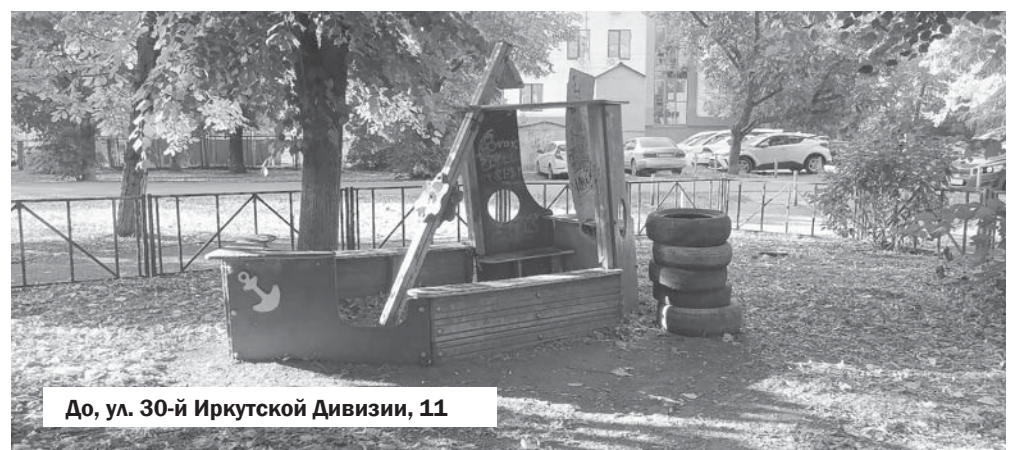
До, ул. 30-й Иркутской Дивизии, 11