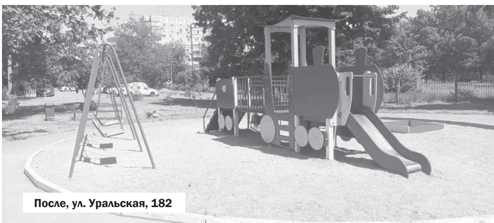
После, ул. Уральская, 182