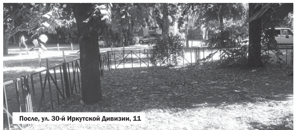
После, ул. 30-й Иркутской Дивизии, 11