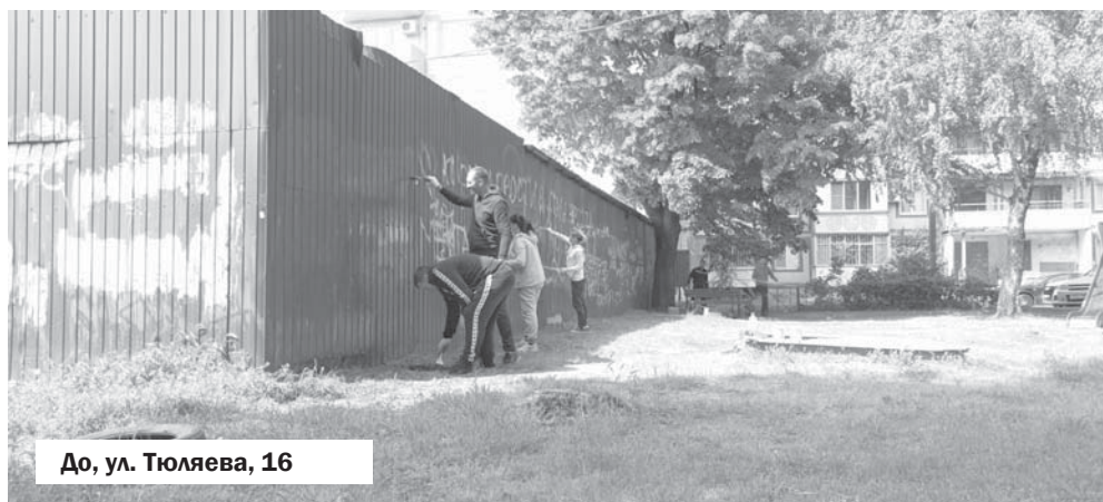
До, ул. Тюляева, 16

Также являюсь советником руководителя дирекции Федерации бокса России в Южном федеральном округе. А в рамках нашей компании курирую деятельность школы