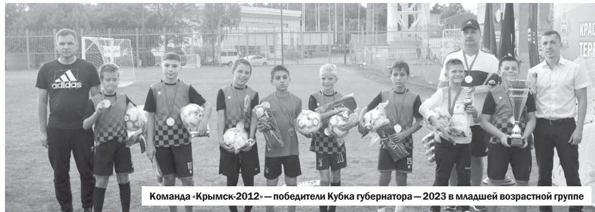
Команда «Крымск-2012» — победители Кубка губернатора — 2023 в младшей возрастной группе

— Как развивались события на футбольном поле?