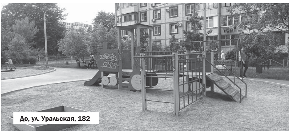
До, ул. Уральская, 182

— Жизнь готовила, наверное. У нас в семье учили к каждому делу относиться серьезно. Родился я в 1987 году в Челябинске. Когда мне исполнилось два года, вместе с родителями и старшим братом переехал в Сочи. Отец воспитывал нас в строгости. Сам он мастер спорта по волейболу, поэтому каждое утро у нас начиналось с интенсивной зарядки. Когда немного подрос, пошел в секцию бокса. Старший брат уже занимался там, и я равнялся на него. Можно сказать, что в теплом климате Сочи мы получали настоящее уральское воспитание. Кубань же