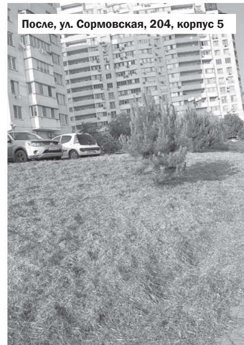
После, ул. Сормовская, 204, корпус 5

— Я хочу, чтобы жители Комсомольского гордились своим микрорайоном. И чтобы эта гордость была подтверждена безопасными дорогами, тенистыми аллеями, цветами на клумбах, чистыми и ухоженными дворами. Я знаю, как должно быть и что делать. Цели поставлены, а я привык их достигать.