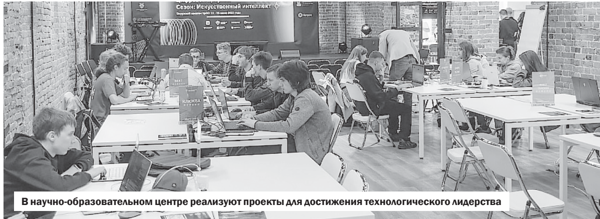
В научно-образовательном центре реализуют проекты для достижения технологического лидерства

Обучение уже прошло более двух тысяч школьников и студентов. Федеральный оператор проекта — автономная некоммерческая организация «Университет национальной технологической инициативы —