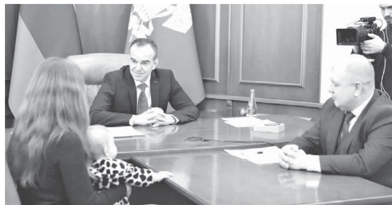
Вениамин Кондратьев провел прием граждан

На прием к Губернатору Краснодарского края пришла также жительница Белореченска, которая обратилась с просьбой провести капитальный ремонт в детском отделении центральной районной больницы (ЦРБ). Здание построили еще в 1989 году. ЦРБ