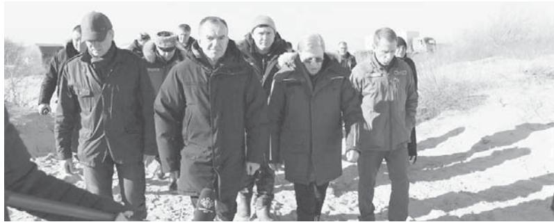
Губернатор Краснодарского края Вениамин Кондратьев ознакомился с работой участников ликвидации последствий чрезвычайной ситуации в Анапе

Губернатор Краснодарского края Вениамин Кондратьев ознакомился с работой участников ликвидации последствий чрезвычайной ситуации в Анапе.