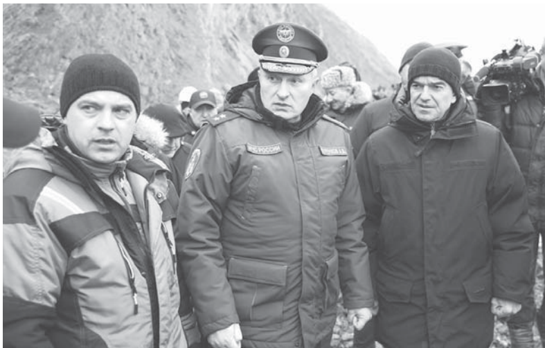
Губернатор Краснодарского края Вениамин Кондратьев и глава МЧС России Александр Куренков проверили темпы ликвидации последствий разлива мазута в районе мыса Панагия

В свою очередь Губернатор Краснодарского края отметил, что такой способ позволит экономить резервы площадки временного хранения в хуторе Воскресенском, а также сохранять уникальные дюны Анапы.