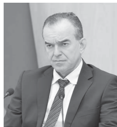
Губернатор Краснодарского края Вениамин Кондратьев принял участие в заседании правительственной комиссии

Губернатор Краснодарского края Вениамин Кондратьев принял участие в заседании правительственной комиссии.