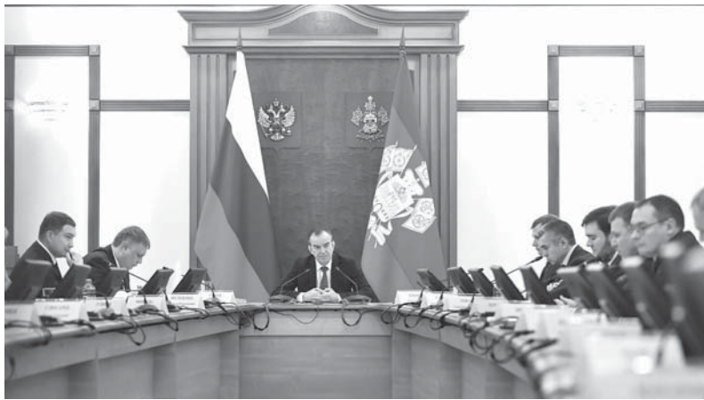
Губернатор Краснодарского края Вениамин Кондратьев провел час контроля

Губернатор Краснодарского края Вениамин Кондратьев провел час контроля.