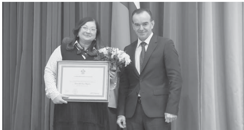
В расширенном совещании, посвященном рассмотрению итогов работы судов за прошлый год, принял участие Губернатор Краснодарского края Вениамин Кондратьев

В прошлом году судами Краснодарского края, включая мировых судей, рассмотрено почти 1,8 миллиона дел и материалов. Большое внимание уделено борьбе