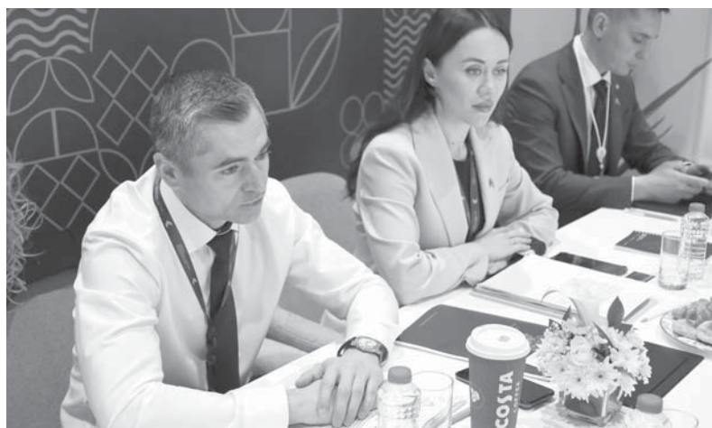
Заместитель Губернатора Краснодарского края Александр Руппель принял участие в международном инвестиционном форуме в Объединенных Арабских Эмиратах

Он уточнил, что на Кубани есть земельные участки, отвечающие всем необходимым критериям подобных инвестиционных проектов.