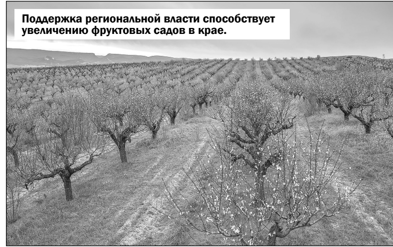
Поддержка региональной власти способствует увеличению фруктовых садов в крае.

диться с жизненными реалиями. В частности, в отрасли растениеводства на конечный результат работы могут повлиять погодные ус-