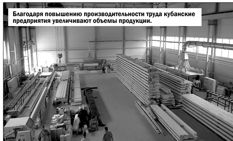
Благодаря повышению производительности труда кубанские предприятия увеличивают объемы продукции.

Чтобы повысить эффективность рабочих процессов, руководство компании проанализировало производственные цепочки на предприятии. Проведенный анализ показал, что узким местом является участок механической обработки. Речь идет об операции зачистки. Для ее оптимизации модернизировали место для слесарных работ.