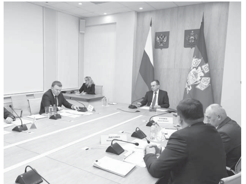
Совещание по вопросам капитального ремонта многоквартирных жилых домов провел Губернатор Краснодарского края Вениамин Кондратьев

Всего в Краснодарском крае их восемьдесят семь. По информации Министерства топливно-энергетического комплекса и жилищно-коммунального хозяйства Краснодарского края, в плане на текущий год девять таких объектов в Краснодаре, Новороссийске