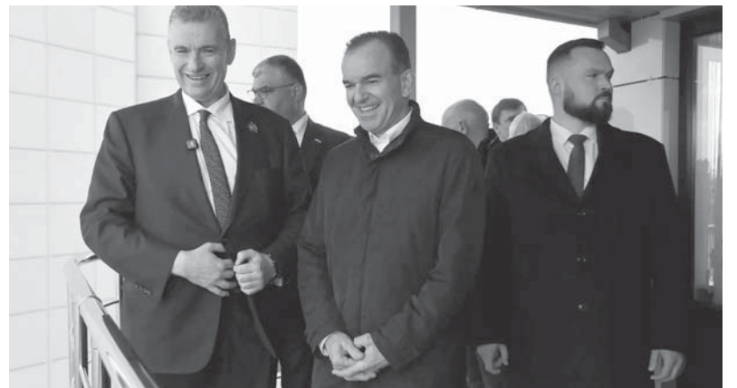
Губернатор Краснодарского края Вениамин Кондратьев высоко оценил достижения спортсменов, участвовавших в чемпионате и Кубке России по гребле на байдарках и каноэ

Губернатор вместе с лидером ЛДПР Леонидом Слуцким встретился со спортсменами и ощутил атмосферу спортивного азарта, наблюдая за финальными заездами мужских и женских экипажей-четверок на пятисотметровой дистанции. Он также лично