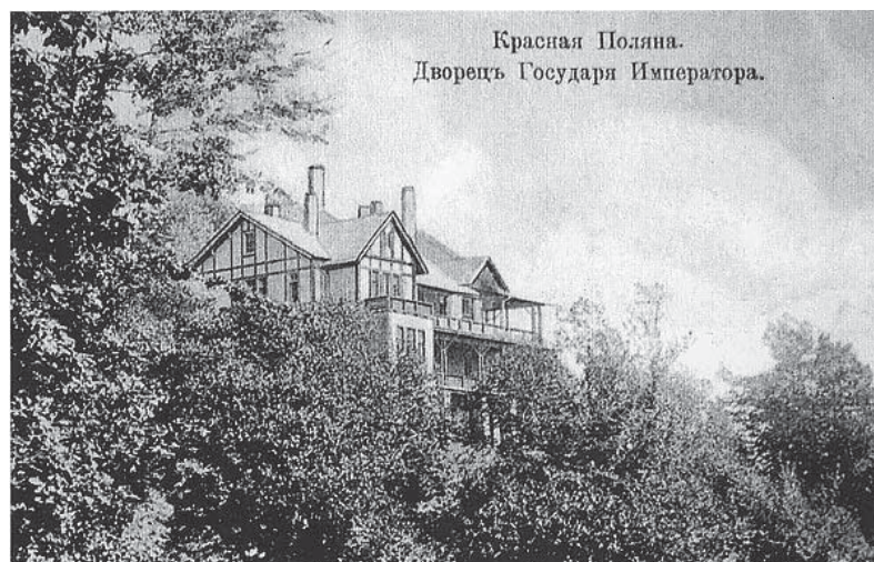
Красная Поляна. Дворец Государя Императора.