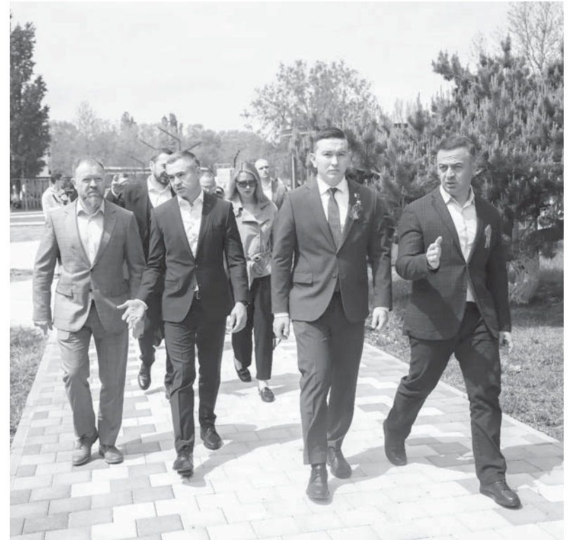
Вице-губернатор Кубани Александр Руппель пообщался с финалистами проекта «ПРОдвижение» в рамках выездного семинара, проходившего на территории детского курорта «Вита» в Анапе

Вице-губернатор Кубани Александр Руппель пообщался с финалистами проекта «ПРОдвижение» в рамках выездного семинара, проходившего на территории детского курорта «Вита» в Анапе.