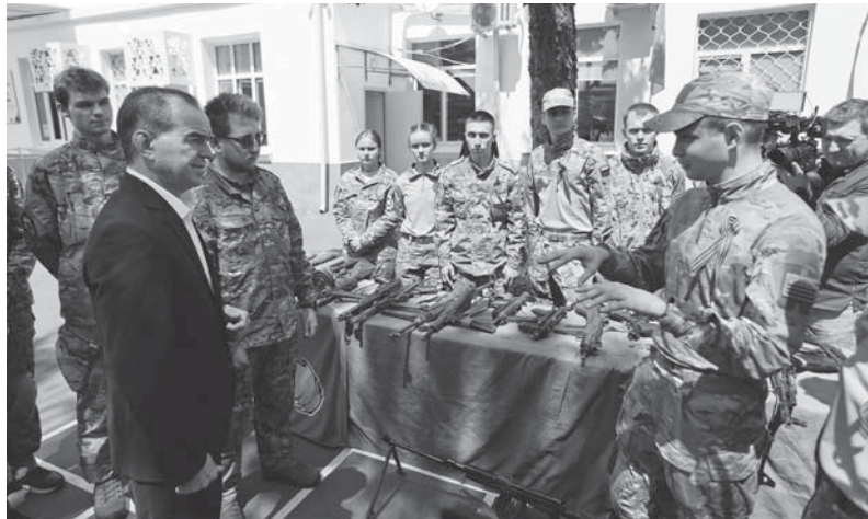
Губернатор Краснодарского края Вениамин Кондратьев провел встречу с представителями молодежных военно-патриотических объединений региона