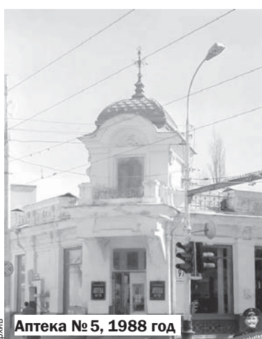
Аптека № 5, 1988 год

украшен лепным декором, элементами разных архитектурных стилей: барокко, классицизма, модерна. Владельцы не жалели средств на украшение: изящный флюгер в форме морского конька, лепной декор, львиные маски, полуколонны, широкий балкон на каменных кронштейнах — общее стилистическое единство интерьеров создавало впечатление богатства и вкуса.