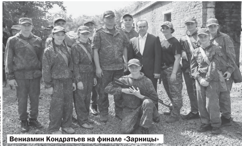
Вениамин Кондратьев на финале «Зарницы»

Любой патриотизм превращается в формальность, если он обращен только в прошлое. В Краснодарском крае сегодня успешно решают задачу формирования образа современного героя, показывая ребятам, что