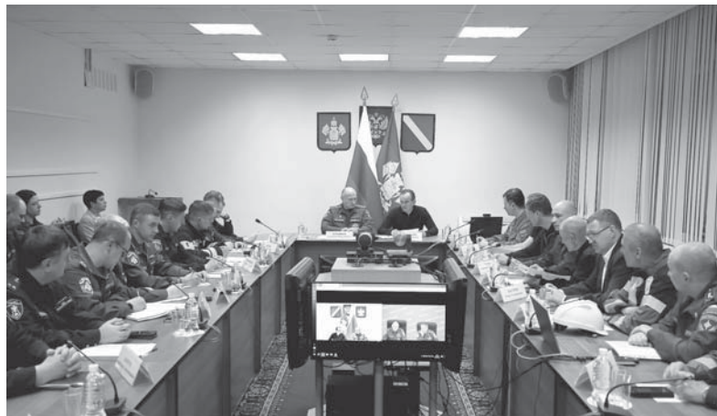
Глава администрации Краснодарского края Вениамин Кондратьев на заседании краевой комиссии, занимающейся вопросами предупреждения и ликвидации чрезвычайных ситуаций и обеспечения пожарной безопасности

Перед заседанием оперативного штаба руководители МЧС и региона совершили облет территории черноморского побережья. По прибытии