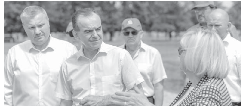
Глава администрации Краснодарского края Вениамин Кондратьев посетил опытные поля федерального государственного бюджетного научного учреждения

Губернатор подчеркнул важность тесного взаимодействия агропромышленного сектора с научным сообществом: это позволяет добиваться высоких производственных результатов и обеспечивать серьезную экономическую ресурсос. Вениамин Кондратьев заключил, что во многом благодаря работе коллектива научного центра Кубань сохраняет статус главной житницы России и остается надежным гарантом продовольственной безопасности всей страны.