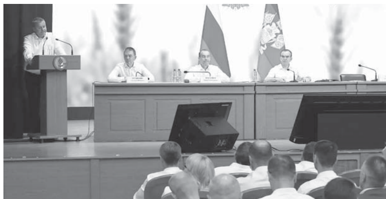
Губернатор Краснодарского края Вениамин Кондратьев провел краевое совещание, посвященное этапам сельскохозяйственных работ

Глава региона также сообщил, что на поля выйдет сорок тысяч единиц сельскохозяйственной техники. Сразу после завершения